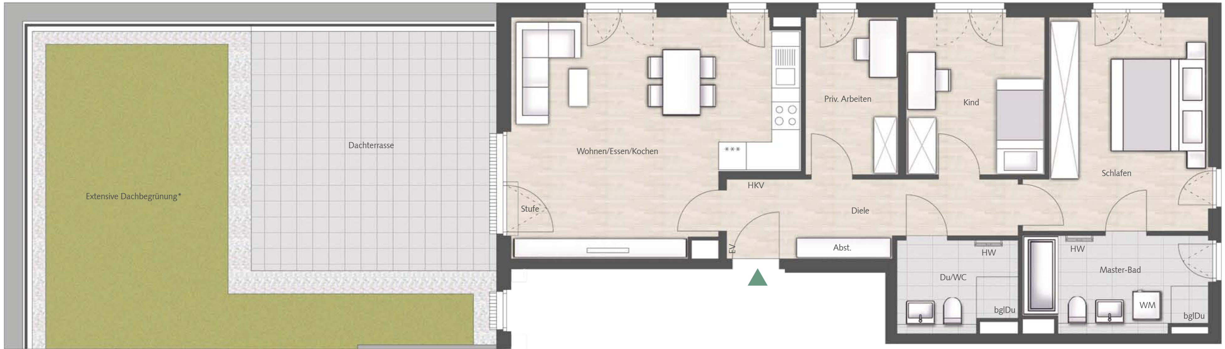
Maßstab ca. 1:50