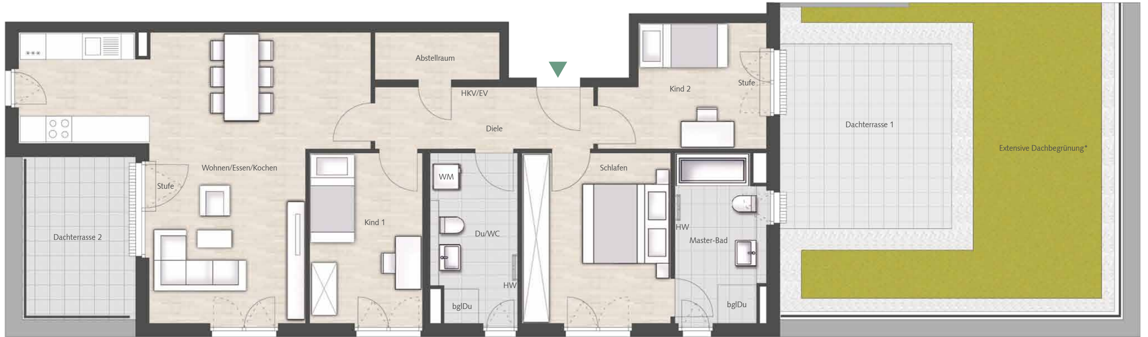
Maßstab ca. 1:50