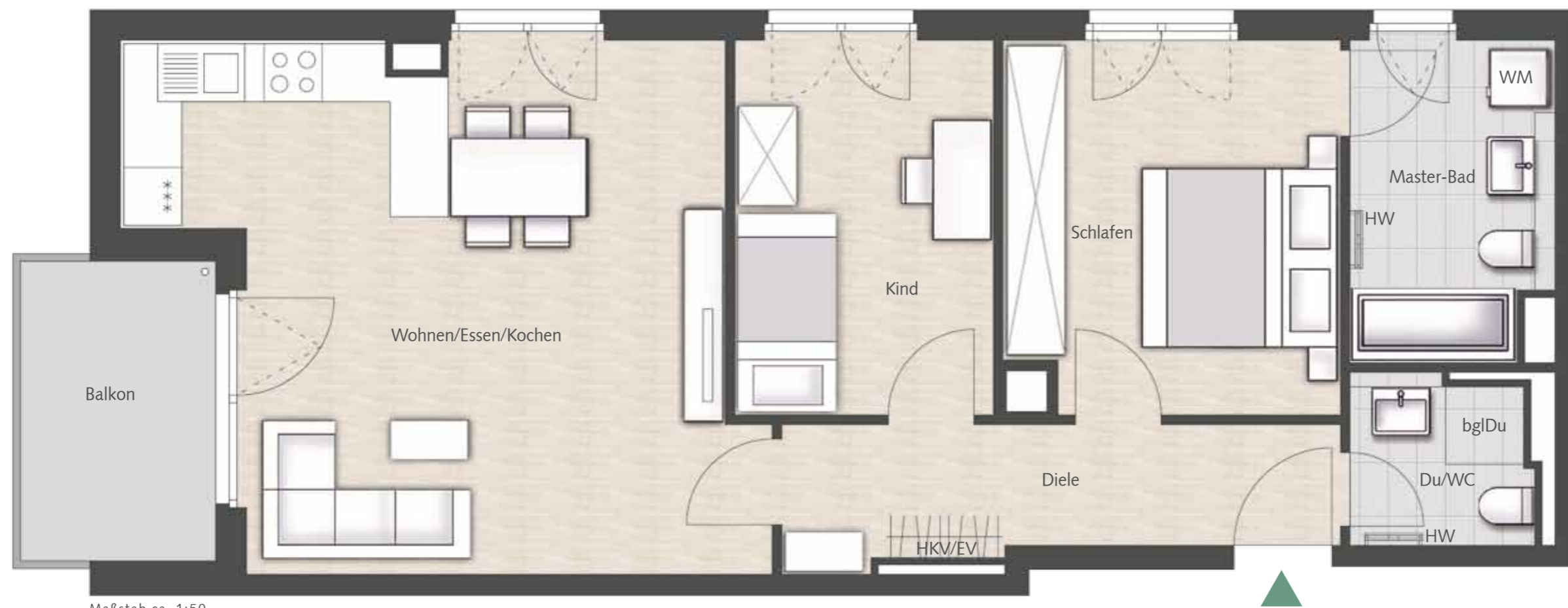
Maßstab ca. 1:50