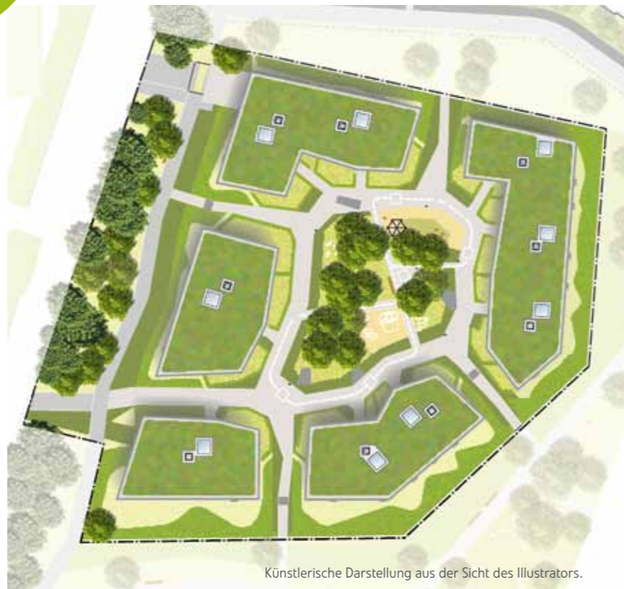
Künstlerische Darstellung aus der Sicht des Illustrators.

„Diese Freiräume, dieses Grün, da möchte ich wohnen!“