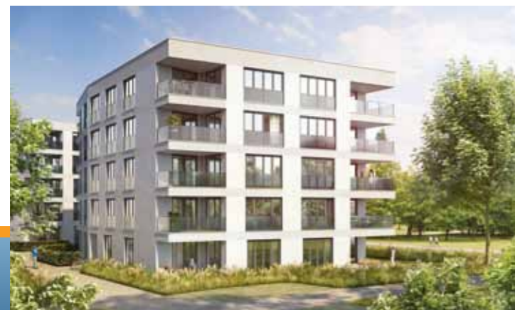
Alle Visualisierungen sind künstlerische Darstellungen aus der Sicht des Illustrators.